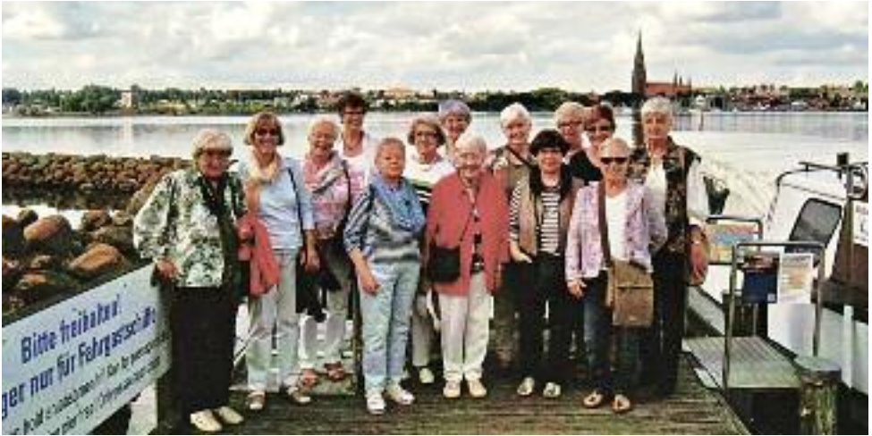
Der Besuchskreis bei seinem „Betriebsausflug“ im Sommer 2016 nach Schleswig und Haithabu