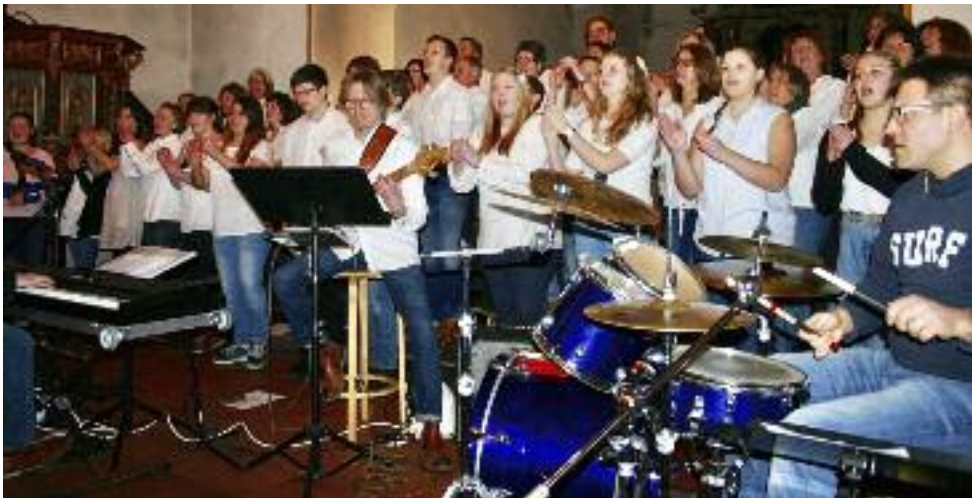
BoGo und SoulTeens gemeinsam. Am 25. Juni, 10 Uhr, bestreiten sie zusammen einen Gospeldienst in der Borbyer Kirche. 13. März 2016

Lassen Sie sich mitreißen und erfahren Sie die frohe Botschaft mal ganz anders.