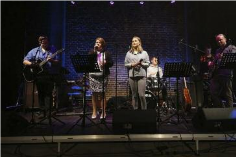
Während des Jugendgottesdienstes wird Jugendlichen die TeamerCard verliehen und es spielt die Borbyer Jugendband. Das wird schön!