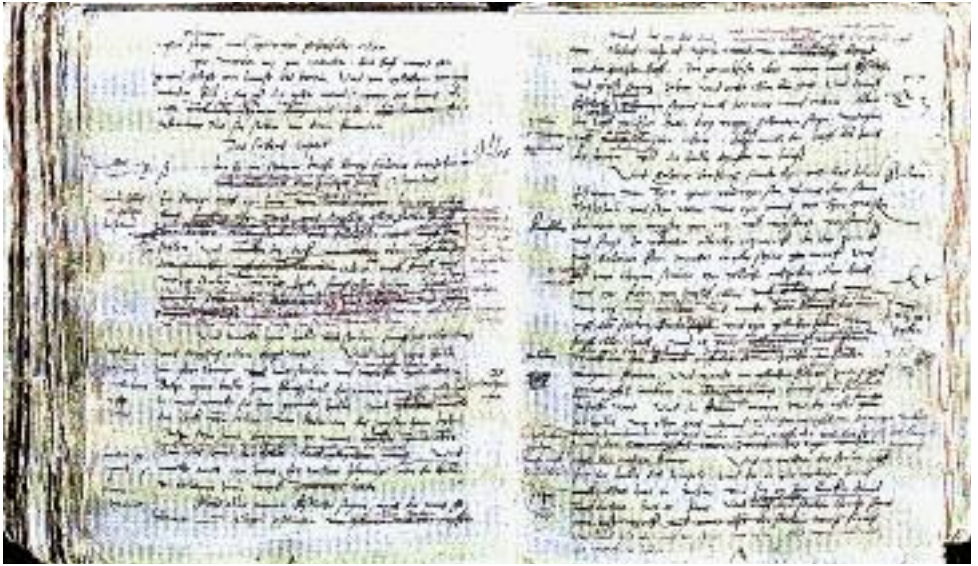
Martin Luther hatte in der unglaublich kurzen Zeit von elf Wochen das Neue Testament auf der Wartburg ins Deutsche übersetzt. Für das Alte Testament dagegen benötigte er zwölf Jahre und die Hilfe von u. a. Philipp Melanchthon. Hier eine Manuskriptseite daraus (1. Könige 7, 1–22).