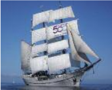
Diesmal findet der Borbyer JuGo auf dem Nordkirchenschiff statt

Echt wahr! Wir dürfen uns freuen - nämlich auf Dienstag, 11. Juli 19:00 Uhr: Unsere Borbyer Teamer_innen und unsere JugendBand freuen sich auch schon riesig auf den nächsten JugendGottesdienst mit breiter Borbyer Beteiligung! Auch, weil es diesmal ein Openair JuGo wird am Hafen mit toller Kulisse vor dem Nordkirchenschiff, das hier in Eckernförde am 11.7. gastiert ( www.nordkirchenschiff.de ). Außerdem freuen wir uns, dass in diesem Gottesdienst unsere JugendBand den Ton angibt