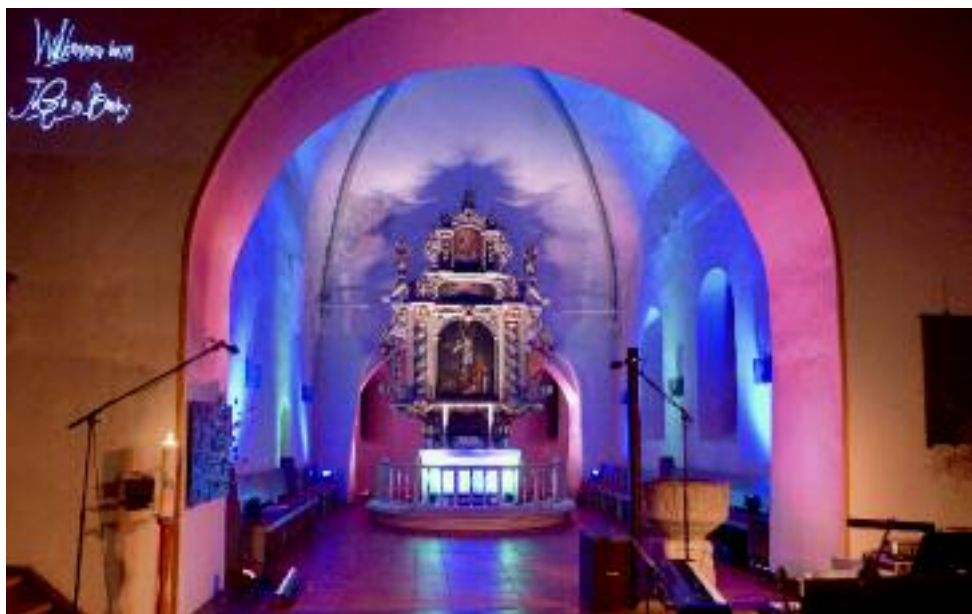
Für einen der vergangenen Jugendgottesdienste wurde der Chorraum bunt illuminiert.